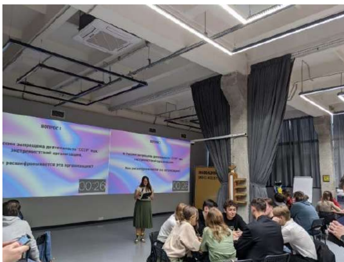
Рисунок 2 – Фрагмент квиза

Формат «Спортивный турнир» . Антитеррористическая компонента может быть встроена и в спортивные мероприятия. Пример – организация турнира в память о герое антитеррористической операции по тому виду спорта, который в юности мог увлекаться данный герой.